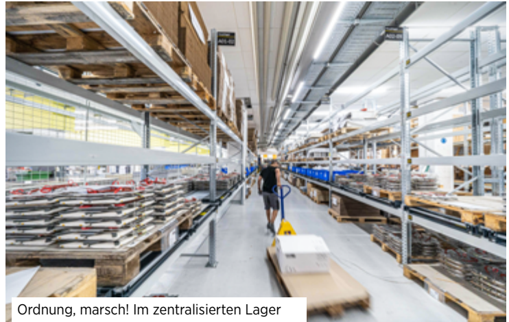
Ordnung, marsch! Im zentralisierten Lager ist nun alles feinsäuberlich eingereicht und mit QR-Codes für die digitale Logistik versehen.