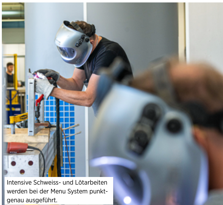
Intensive Schweiß- und Lötarbeiten werden bei der Menu System punktgenau ausgeführt.