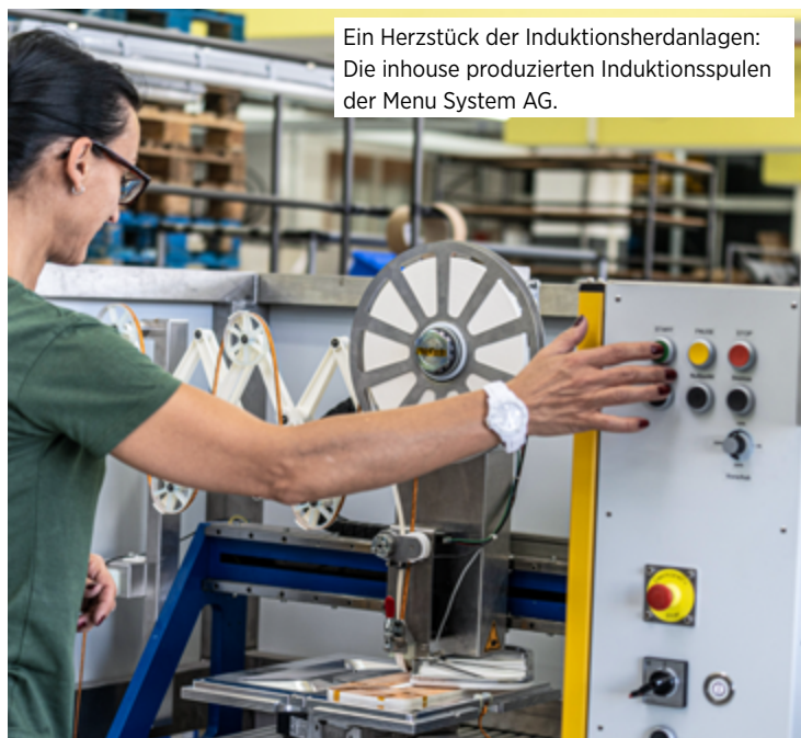
Ein Herzstück der Induktionsherdanlagen: Die inhouse produzierten Induktionsspulen der Menu System AG.