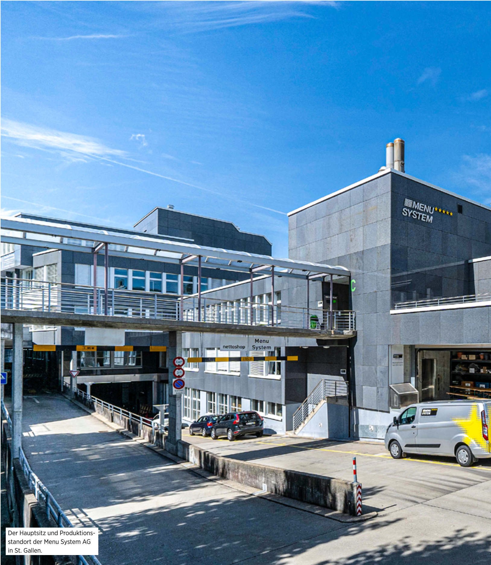
Der Hauptsitz und Produktionsstandort der Menu System AG in St. Gallen.