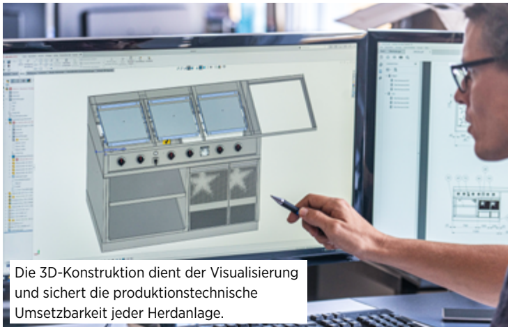
Die 3D-Konstruktion dient der Visualisierung und sichert die produktionstechnische Umsetzbarkeit jeder Herdanlage.