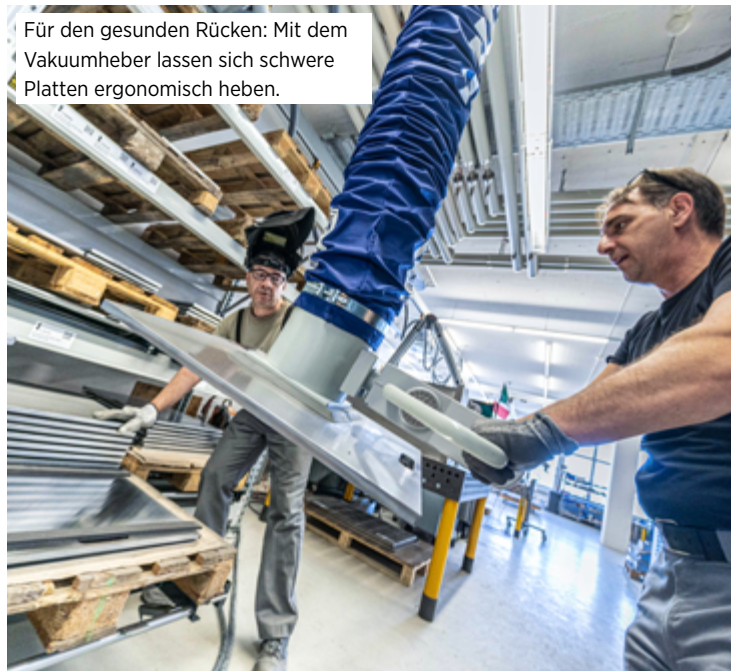
Für den gesunden Rücken: Mit dem Vakuumheber lassen sich schwere Platten ergonomisch heben.