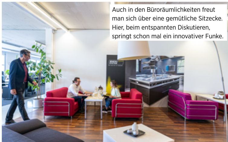
Auch in den Büroräumlichkeiten freut man sich über eine gemütliche Sitzzecke. Hier, beim entspannten Diskutieren, springt schon mal ein innovativer Funke.