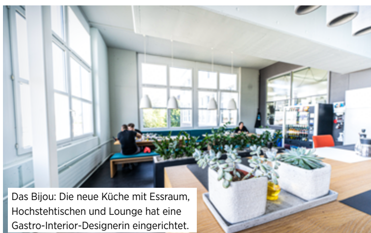
Das Bijou: Die neue Küche mit Essraum, Hochstehischen und Lounge hat eine Gastro-Interior-Designerin eingerichtet.