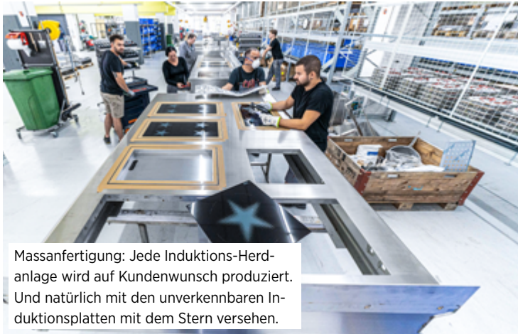
Massanfertigung: Jede Induktions-Herdanlage wird auf Kundenwunsch produziert. Und natürlich mit den unverkennbaren Induktionsplatten mit dem Stern versehen.